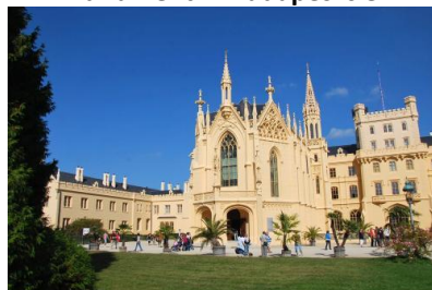
Zespół Pałacowy Lednice