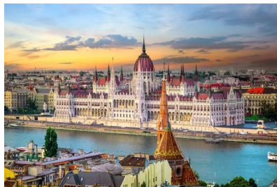
Parlament w Budapeszcie