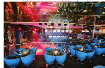
Miejsca nocnej rozrywki, muzyki