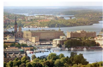
Pałac królewski w Sztokholmie