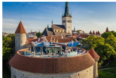
Stare miasto w Tallinie