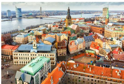
Stare miasto w Rydze