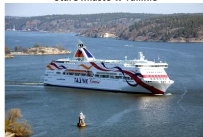
Prom Tallin - Helsinki