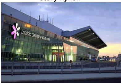
Lotnisko F. Chopina na Okęciu