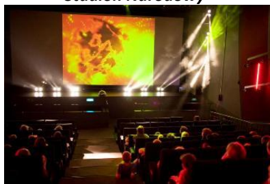
Cinema Park – Sala muzyki