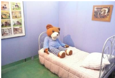
Muzeum Animacji w Łodzi

Koszt programu zimowiska na uczestnika – 750 zł