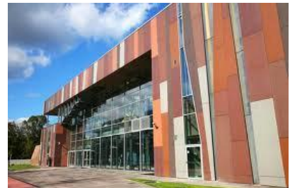
Centrum Nauki Kopernik