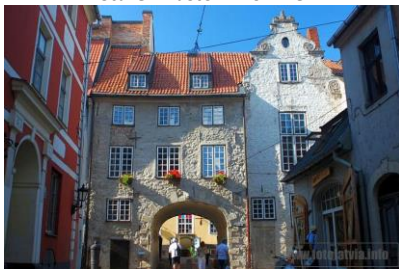
Brama Szwedzka w Rydze