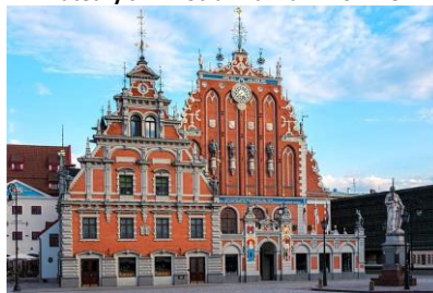
Dom Bractwa Czarnogłowych w Rydze