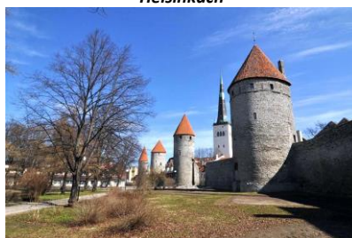
Mury miejskie w Tallinnie