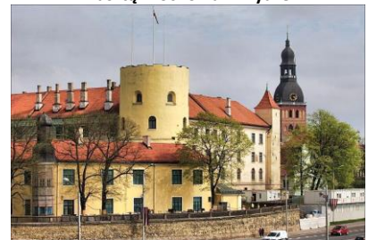
Zamek Kawalerów Mieczowych w Rydze