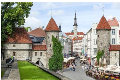
Dolne miasto w Tallinnie