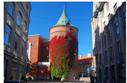
Baszta Prochowa w Rydze