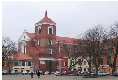
Katedry św. Piotra i Pawła w Kownie