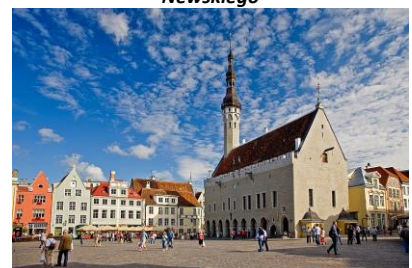
Plac Ratuszowy w Tallinnie

Program stanowi propozycję, którą na życzenie można zmieniać.