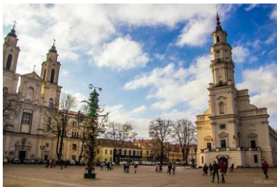
Stare Miasto w Kownie