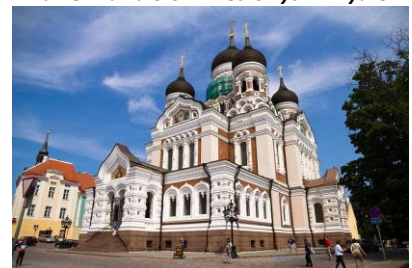
Wzgórze Toompea - Sobór Aleksandra Newskiego