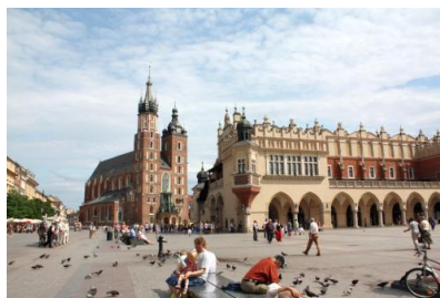
Stary Rynek w Krakowie