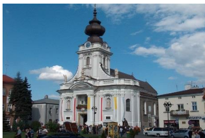
Bazylika w Wadowicach