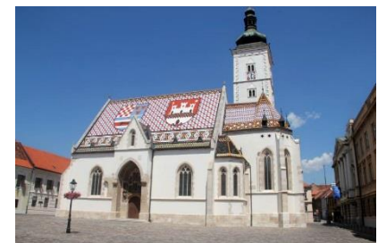
Kościół Św. Marka w Zagrzebiu