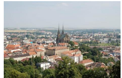
Widok na śródmieście Brna