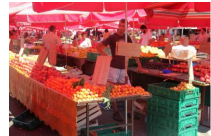
Targ w centrum Zagrzebia