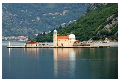
Wyspa Matki Boskiej na Skale