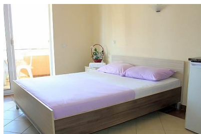
Pokój w hotelu