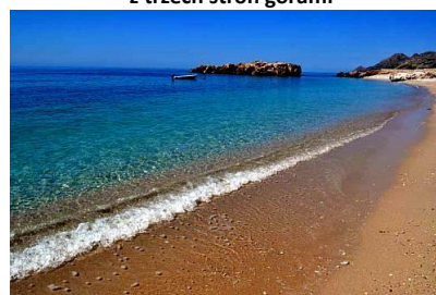
Plaża w Czarnogórze