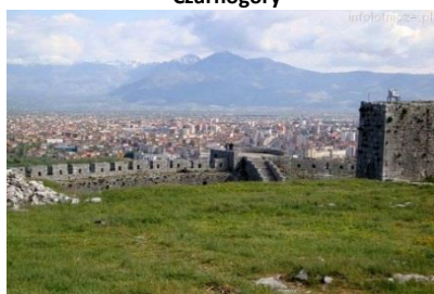
Twierdza Rozafa w Szkodrze