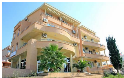
Hotel w Dobrej Vodzie

10 dzień - 25.07.16 poniedziałek - śniadanie około 6:00, wyjazd w drogę powrotną, przejazd przez Słowenię, Austrię, Czechy i Polskę, przyjazd w godzinach wieczornych do Słupcy.