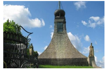
Pola bitwy pod Austerlitz

Kolejność zwiedzanych obiektów może ulec zmianie. Uczestnik wyjazdu musi posiadać dowód osobisty lub paszport.