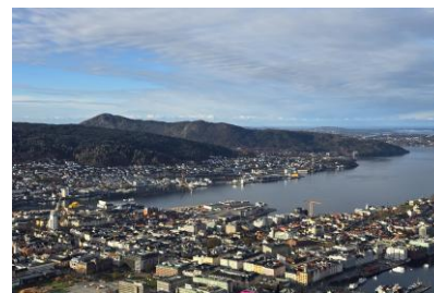
Widok ze wzgórza Floyen na Bergen