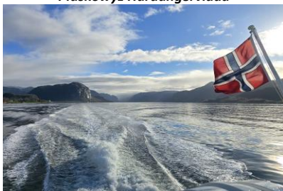
Rejs po fiordzie na trasie Gudvangen - Flam