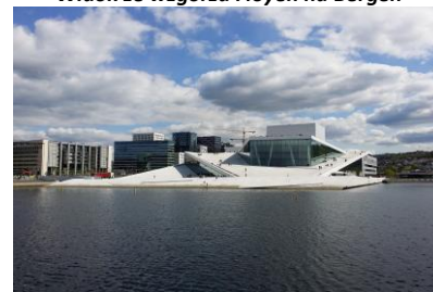
Opera w Oslo