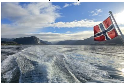
Rejs po wodach Lysefiordu