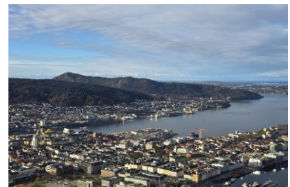
Widok ze wzgórza Floyen na Bergen