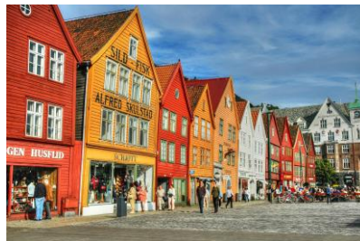
Nabrzeże Bryggen w Bergen