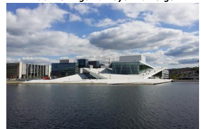
Opera w Oslo