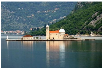
Wyspa Matki Boskiej na Skale