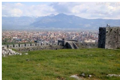
Twierdza Rozafa w Szkodrze