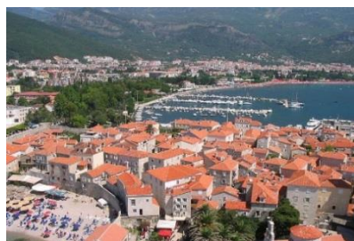
Budva – turystyczne „zagłębienie” Czarnogóry