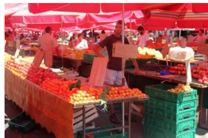
Targ w centrum Zagrzebia