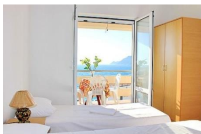
Pokój w hotelu