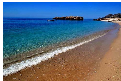
Plaża w Czarnogórze