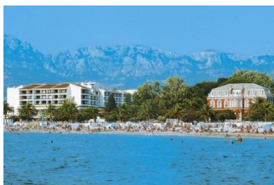
Największe miasto Czarnogóry - Bar