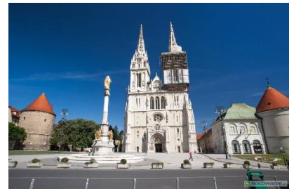
Katedra w Zagrzebiu

Kolejność zwiedzanych obiektów może ulec zmianie. Uczestnik wyjazdu musi posiadać dowód osobisty lub paszport.