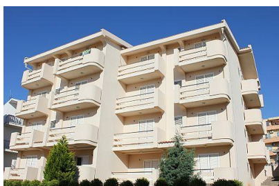
Hotel w Dobrej Vodzie

Kalkulacja obowiązuje przy kursie euro w przedziale 4,15 - 4,40 zł.