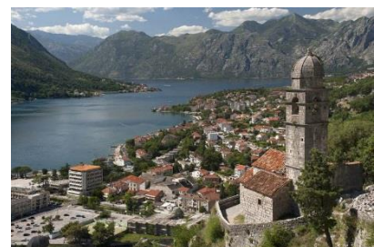
Kotor – miasto otoczone z trzech stron górami

Biuro Usług Turystycznych Orchowscy, 62-400 Sępca, ul. Wojska Polskiego 6