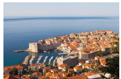
Dubrovnik miasto z listy UNESCO