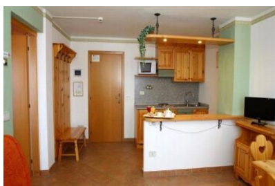
Pokój w hotelu