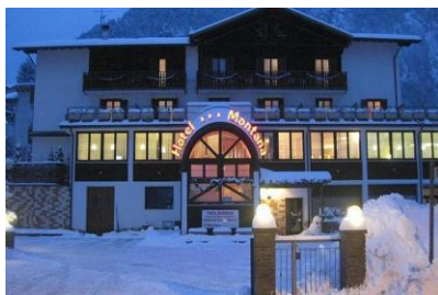
Hotel w Fai della Paganella.