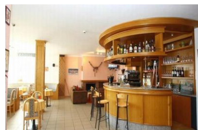
Barek w hotelu

W związku z koniecznością rezerwacji i potwierdzenia hoteli wymagana jest jak najszybsza deklaracja udziału w wyjeździe w formie e-mailowej oraz wpłata zaliczki w wysokości 700 zł od osoby.