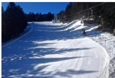
Stacja narciarska Paganella