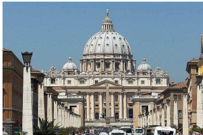
Bazylika Św. Piotra