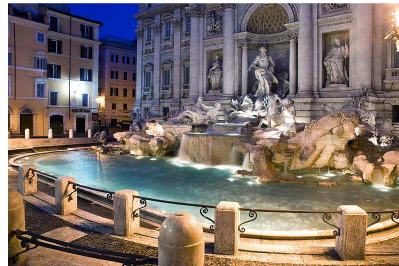
Fontanna di Trevi